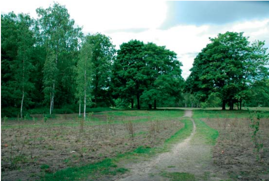
Blick von Osten (von der Ebertstraße) auf das Wettbewerbsgrundstück

View from the east (from Ebertstraße) of the site of the competition