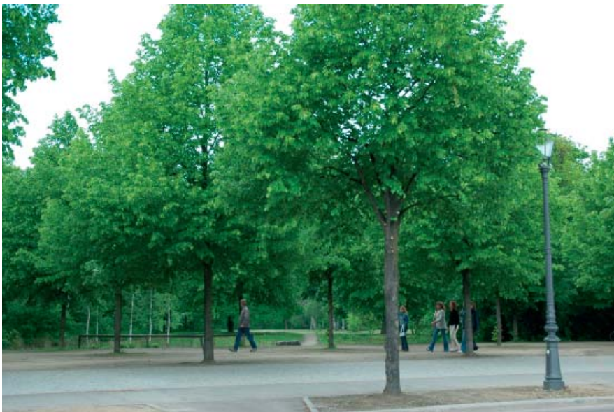
Blick von Osten (von der Ebertstraße durch den Lenné'schen Baumsaal) auf das Wettbewerbsgrundstück

View from the east (from Ebertstraße) of the site of the competition