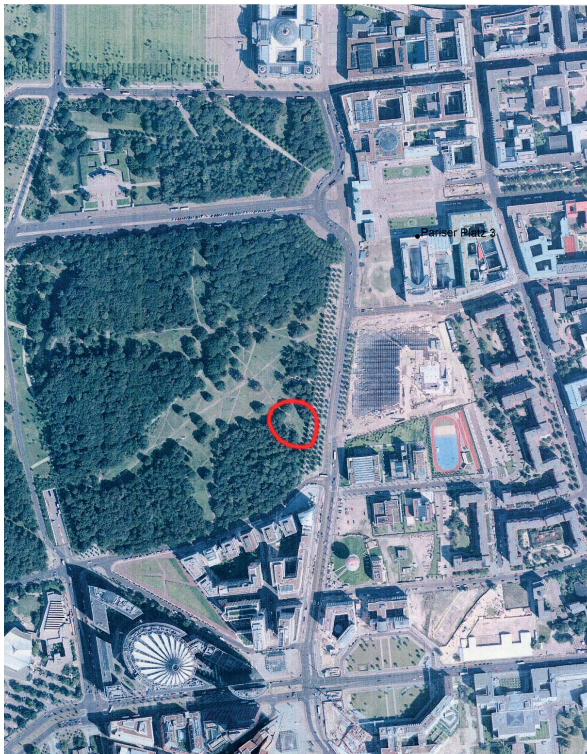
Luftbild mit geplantem Standort Aerial photo showing the planned location